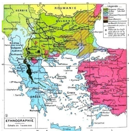
Λήξη του Β ' Βαλκανικού Πολέμου.